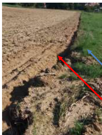
Prairie à fascines Sillon

Les fascines au lieu-dit Fluss ont bien retenu la boue venant des parcelles en amont.