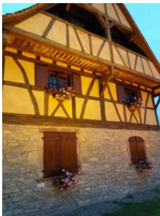
Maison des associations

En raison de l'augmentation des effectifs à Willgottheim, la cantine et la garderie ont été transférées de la maison des associations à la salle communale.