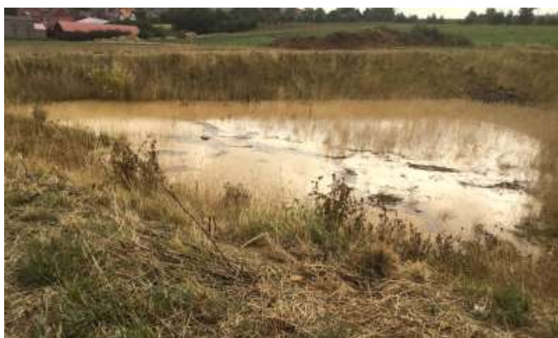
Bassin de rétention le long du chemin rural en enrobé